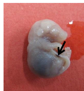
شکل ۴: جنین تجربی III (دوز ۴۵ میلی گرم بر کیلوگرم گاباپنتین) که دارای خونریزی در ناحیه دم (فلش) می باشد.

در گروه تجربی I ۱۴ جنین (۱۲/۶۱ درصد)، در گروه تجربی II ۱۸ جنین (۱۸ درصد) و در گروه تجربی III ۱۷ جنین (۱۷/۱۷ درصد) دارای خونریزی های موضعی در نواحی مختلف بدن از جمله دست ها، پاها، گردن، ستون فقرات و دم بودند (شکل ۱).