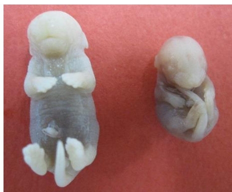
شکل ۳: جنین تجربی I (دوز ۳۰ میلی گرم بر کیلوگرم گاباپنتین) (موش سمت راست) در مقایسه با گروه شاهد (موش سمت چپ) از نظر طول سری - دمی.

یافته های تحقیق بر اساس برش سزارینی در روز هجده و نیم بارداری (GD18.5) در جدول یک نشان داده شده است. در گروه های تجربی تزریق درون صفاقی گاباپنتین سبب بروز باز جذب جنینی شده و این موضوع به لحاظ آماری در گروه های تجربی I، II و III نسبت به گروه شاهد معنی دار بود (جدول ۱). میانگین وزن بدن جنین ها در هر سه گروه تجربی I (۱/۲۷±۰/۲۲ گرم)، گروه تجربی II (۱/۱۷±۰/۲۵ گرم) و گروه تجربی III (۱/۱۵±۰/۲۶ گرم) به صورت معنی داری ( P < 0.001 ) در مقایسه با گروه کنترل (۱/۴۳±۰/۱۷ گرم) کاهش یافته بود. طول سری - دمی جنین ها نیز در گروه های تجربی II و III نسبت به گروه کنترل کاهش معنی داری ( P < 0.001 ) داشت (جدول ۱ و شکل ۳).